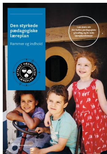
Den styrkede pædagogiske læreplan, Rammer og indhold